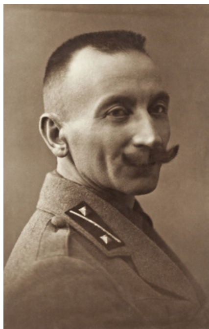
P. Radziņš Atbrīvošanās kara laikā 1919.-1920. gads

kumiem: „Pirmā tāda liktenīgā diena, kas manā atmiņā uzglabājusies un kas saistīta ar ģenerāļa Radziņa vārdu, ir 1919. gada 13.oktobris. Atceros, todien pie manis Pļaviņās kā pie austrumfrontes virspavēlnieka ceļā uz Varšavu ieradās mūsu valdības delegācija ar Z.Meierovicu priekšgalā. Delegācija devās uz Poliju, lai iegūtu no maršala Pilsudska reālu palīdzību mūsu neatkarības cīņās pret toreiz kopēju ienaidnieku. Nelaiķis Meierovics mani valdības vārdā uzaicināja uzņemties Latvijas armijas virspavēlnieka posteni. Tas bija vakarā, mēs daudz spriedām un pārrunājām ar delegāciju, pārrunājām arī to, kam uzticēt štāba priekšnieka amatu. Es izprasīju laiku pēkšņā priekšlikuma pārdomāšanai līdz nākošajam rītam. Delegācija pārgulēja Pļaviņās pa nakti. Jau nākošās dienas notikumi sāka strauji risināties. Delegācija aizbrauca tālāk uz Varšavu, kur viņas ceļu nejauši krustoja no Dienvidkrievijas atgriezies ģen. Radziņš, bet es 16.oktobra