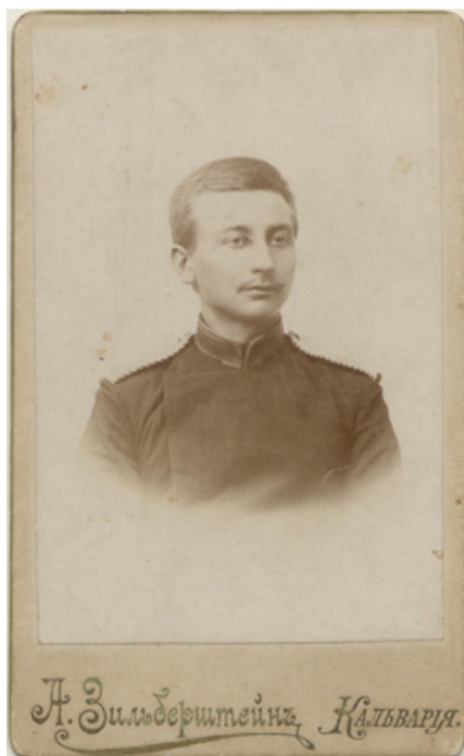
1898. gada augustā kā ierindnieks ar II šķiras brīvprātīgā tiesībām iestājās Kalvarija (Suvalku guberņā) dislocētājā 112. Urālu kājnieku pulkā